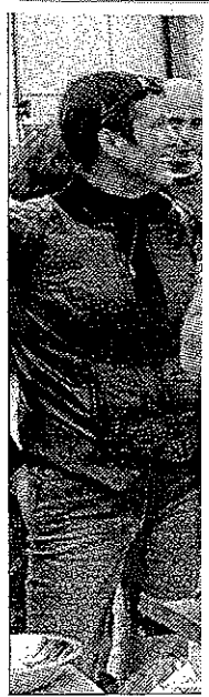
Face aux milit

À Montdidier, ce sont près de dix personnes partageant la même idéologie que cette association qui ont organisé cette « veillée nocturne statique et silencieuse ». Une poignée d'entre eux avait même prévu une tente pour rester jusqu'à 5 heures du matin, l'heure d'ouverture de l'abattoir. « L'idée, c'est de se recueillir auprès des animaux qui vont être prochainement abattus, explique